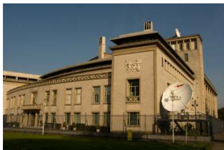
Mezinárodní trestní tribunál pro bývalou Jugoslávii v Haagu

Vliv propagandy na osoby, které byly souzeny tribunálem za válečné zločiny, nám potvrdil například i Milan Babić, první prezident Republiky Srbské Krajiny (RSK). Přiznal vinu za zločiny, z nichž byl obviněn, a uvedl, že v počátcích své politické kariéry byl sám silně ovlivněn a uveden v omyl srbskou propagandou opakovaně referující o možné genocidě vůči Srbům ze strany chorvatského státu, který přirovnával k chorvatskému fašistickému režimu z doby 2. světové války (Ustašovcům), čímž byla mezi Srby cíleně vyvolávána atmosféra nenávisti a obav z Chorvatů.