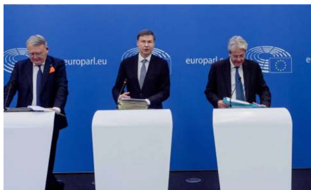
Tisková konference po jednání Komise

v dnešním evropském semestru, je nezbytné koordinovat politiky v celé EU, abychom dokázali lépe překonat bezprostřední obtíže a posílili naše dlouhodobé hospodářské vyhlídky. Naše priority jsou zřejmé: zajistit cenově dostupné dodávky energie a chránit zranitelné domácnosti a podniky před vysokými cenami energie. Naše budoucí prosperita závisí na stimulaci inovací a vytváření konkurenceschopných podniků s vysoce kvalifikovanými pracovníky, které potřebujeme pro zelenou a digitální budoucnost," řekl k představovanému souboru opatření výkonný místopředseda Komise pro hospodářství ve prospěch lidí Valdis Dombrovskis.