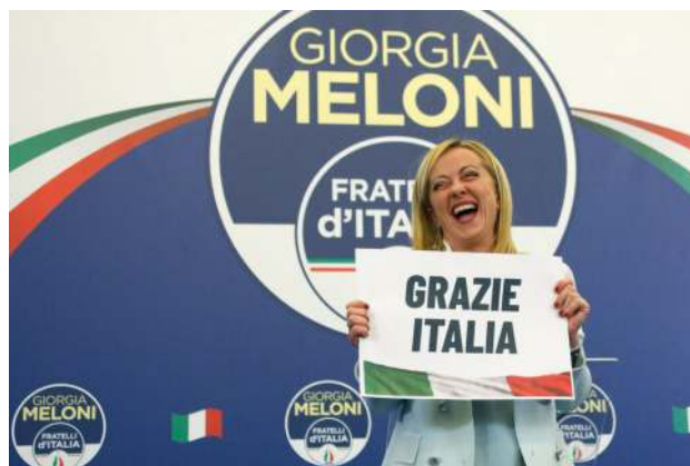
Giorgia Meloniová děkuje svým voličům

Ruskou agresí Georgia Meloniová tvrdě odsoudila a byla jednou z mála na italské politické scéně, kdo podpořili dodávky zbraní na Ukrajinu.