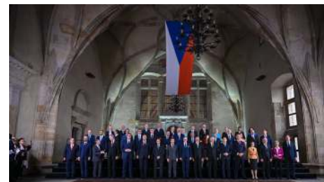
44 vrcholných představitelů diskutovalo na Pražském hradě

Charles Michel, nebo šéf unijní diplomacie Josep Borell.