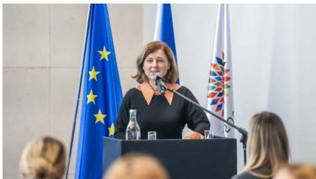
Česká eurokomisařka a místopředsedkyně Evropské komise Věra Jourová.

Místopředsedkyně Evropské komise a komisařka pro hodnoty a transparentnost Věra Jourová na začátku své řeči zdůraznila, že je velmi nebezpečné brát hodnoty jako samozřejmost. Zároveň vyjádřila obavu, že z členských států Evropské unie neslyší dostatečně silné hlasy, které by tyto hodnoty zastávaly, jelikož jsme zvyklí je mít automaticky. Během pandemie koronaviru jsme jako společnost byli svědky nárůstu nejen domácího násilí, ale i násilí v digitálním prostoru. Z tohoto důvodu se Komise poprvé rozhodla ve svých nařízeních zdůraznit i význam potlačení digitálního násilí. „Jde o velmi důležitý aspekt Celounijních pravidel pro potírání násilí na ženách,“ dodává Jourová.