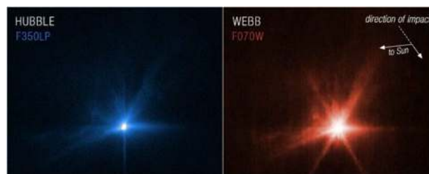
Detailní snímky dopadu sondy DART pořízené Hubbleovým vesmírným teleskopem a teleskopem Jamese Webba.

Asi půltunová sonda DART byla do vesmíru vypuštěna loni na podzim v rámci projektu, na němž s agenturou NASA spolupracovala i Evropská vesmírná agentura. Projekt měl rozpočet 330 milionů dolarů (asi 8,5 miliardy korun). O tom, zda a jak se podařilo změnit trajektorii měsíce, bude agentura NASA informovat za několik dnů či týdnů.