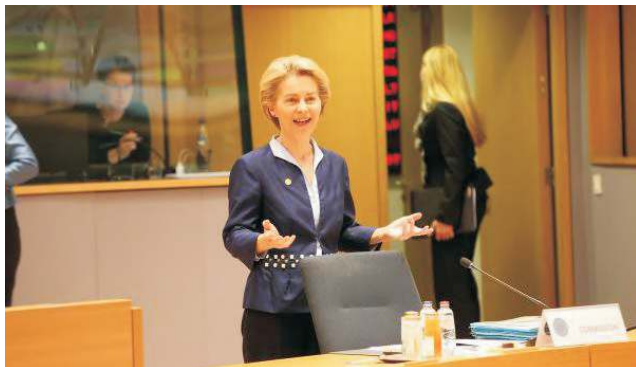
Předsdkyně Komise Ursula von der Leyenová

toto úsilí se spojí v evropském klimatickém paktu, ke kterému se budou moci vyjadřovat regiony, místní společenství, občanská společnost, školy, zástupci průmyslu i jednotlivci. EU povede rovněž mezinárodní jednání před konferencí COP26 v Glasgow. Komise předloží podněty k řešení ztráty biologické rozmanitosti a prostřednictvím strategie „od zemědělce ke spotřebiteli“ podpoří zemědělce, aby udržitelnějším způsobem dodávali vysoce kvalitní, cenově dostupné a bezpečné potraviny.