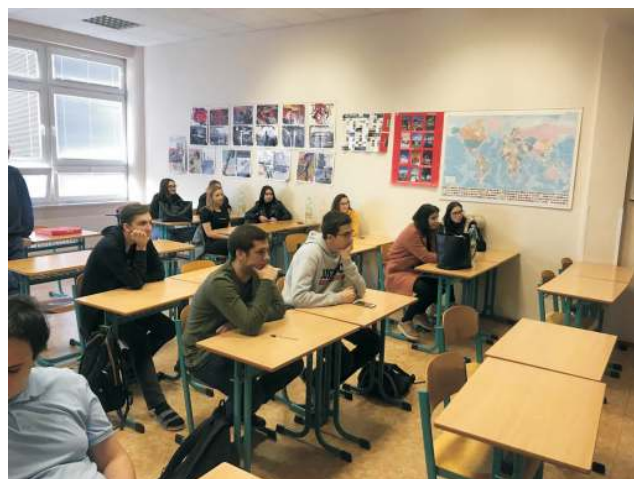
Autor: Nikola Pavlůsková, Eurocentrum Brno

Chcete se o EU taky něco dovědět? Napište nám a třeba bude příští přednáška právě u vás!