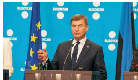
Místopředseda Komise Andrus Ansip

Ostrý spor mezi představiteli tvůrců, kteří žádali vyšší ochranu svých autorských děl třeba na Youtube, a zastánci velkých internetových firem i ochránců "svobodného internetu" vedl k tomu, že se v posledních měsících okolo nové směrnice vedla ostrá debata a důrazně se lobbovalo.