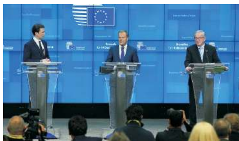
Sebastian Kurz, Donald Tusk a Jean-Claude Juncker na prosincovém summitu Evropské rady v Bruselu.

Ve dnech 13. a 14. prosince 2018 se v Bruselu uskutečnilo řádné zasedání Evropské rady. Jednalo se o poslední setkání lídrů členských zemí v rámci rakouského předsednictví v Radě EU. Českou delegaci vedl předseda vlády Andrej Babiš. Hlavními tématy prosincové Evropské rady byly otázky brexitu, víceletého finančního rámce, migrace, zahraničních vztahů a téma dalšího prohlubování hospodářské a měnové unie.