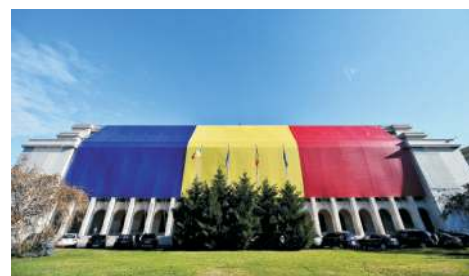
Vítězný palác v Bukurešti, sídlo rumunské vlády.

Bezpečnost je další z priorit Bukurešti. Naváže tak na končící půlrok Vídně, která měla bezpečnost, otázky migrace a azylového systému a stabilitu v evropském příhraničí taktéž jako svou prioritu. Rumunsko se zaměří na posilování vnitřní bezpečnosti, správu hranic a mimo jiné také na otázku fungování schengenského prostoru.