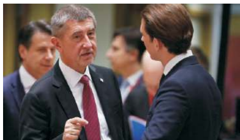
Český premiér Andrej Babiš a rakouský kancléř Sebastian Kurz.

Kdy? 21.1.; 16:30-18:00 Kde? Knihovna Kroměřížska, Slovanské náměstí 3920/1, Kroměříž.