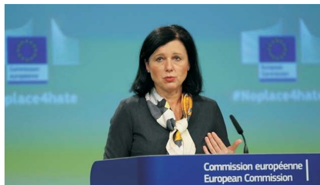
Česká eurokomisařka Věra Jourová.