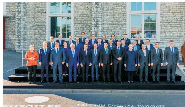
Státníci při digitálním summitu v Tallinnu v září 2017.

spojených s dodávkou elektřiny či na podmínkách regionální spolupráce. V prosinci letošního roku pak Rada dosáhla souhlasu s Parlamentem v otázce energetické efektivity budov.