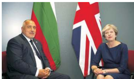
Bulharský premiér Bojko Borisov a britská ministerská předsedkyně Theresa Mayová.

Od počátku ledna bude na půl roku předsedat členským zemím Evropské unie Bulharsko. Země, která pomyslné žezlo přebírá od pobaltského Estonska, si pro své první předsednictví EU zvolila jako klíčová tři slova - bezpečnost, stabilitu a solidaritu.