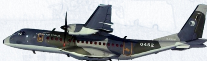
CASA C-295M, Vzdušné síly AČR