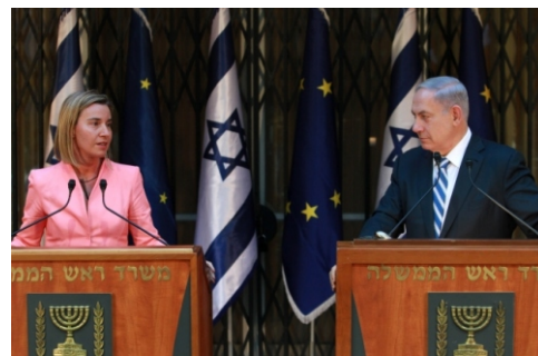
Federica Mogherini a Benjamin Netanjahu

Ekonomicky jde například o rozdílné označování výrobků, které pocházejí z osad, protože se podle mezinárodního práva nacházejí na Izraelem ilegálně okupovaném území. Požadavek na takto jasné značení potravin poslalo v dopise Mogheriniové celkem 16 ministrů zahraničí členských států EU.